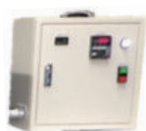
制御部 (コントローラ)